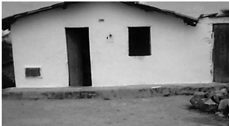
FIGURA 1: APRESENTAÇÃO DO TIPO DE MORADIA DOS IDOSOS COM SEQÜELAS DE AVE. (REIS, L. A. JEQUIÉ-BA, 2005)

Na caracterização da rua ou via de acesso (compreendendo passagem, entrada, meio utilizado para se chegar ao domicílio, que no caso de nosso objeto de estudo podem ser escadarias, ruelas e becos) quanto à inclinação, notamos que 30% eram planas, 20% inclinadas e 50% levemente inclinadas (Tabela 1). Quanto à pavimentação, uma (10%) das casas dispõe de calçamento e as demais (90%) não dispõem de calçamento,